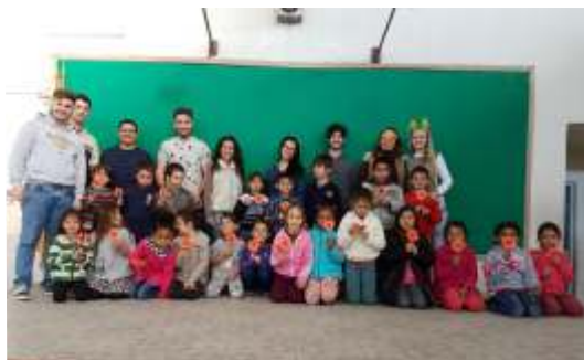
Grupo de pesquisa coordena ação comunitária na Escola Osmany Vêras.

É preciso, contudo, esclarecer que a liderança não irá resolver todos os anseios do Bairro Medianeira, mas é inegável que a capacidade dos líderes serem agentes de sua história, buscando a realização de suas necessidades e a cooperação da comunidade, criando laços de confiança, organizando-se em redes e em parcerias, em torno de valores e objetivos comuns, vai depender fundamentalmente de suas lideranças.