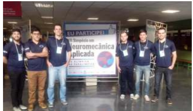
Participação do Grupo de Pesquisa em Biomecânica do VII Simpósio de Neuromecânica Aplicada, sendo o referido evento realizado na Cidade de Curitiba no ano de 2016.

Eletromiografia e controle postural em atletas de handebol e praticantes de musculação".