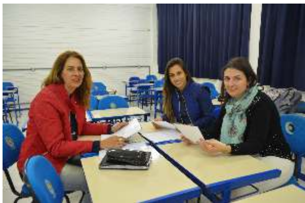
Apresentação da pesquisa intitulada "O fazer docente e o currículo: onde atuam e o que pensam as alunas egressas do curso de Pedagogia da FACOS/ Osório" na VII Mostra Integrada de Iniciação Científica, I Salão de Pesquisa e I Salão Jovem, no dia 25/10/2016.

Estudos apontam que as temáticas currículo e formação de professores são recorrentes nas discussões atuais, já que pensar currículos e estruturar currículo em instituições de ensino requer do docente conhecimento teórico que dê suporte para a uma prática condizente com as demandas da contemporaneidade, com uma prática que analise os movimentos de ensinar e aprender e que trabalhe com os saberes de forma articulada, integrada, em redes.