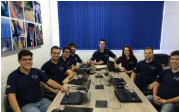
Reunião semanal do Grupo de Pesquisa em Biomecânica.

Diante disso, o presente estudo busca comparar variáveis do equilíbrio postural, potência de membros inferiores e o desempenho neuromuscular em adultos-jovens e idosos, sedentários e ativos.