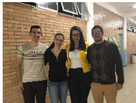
Acadêmicos envolvidos no projeto de pesquisa.

processo possibilita aos enfermeiros uma melhor efetividade no método de abordagem a essas pacientes e que este possam realizar este exame de forma mais tranquila e natural.