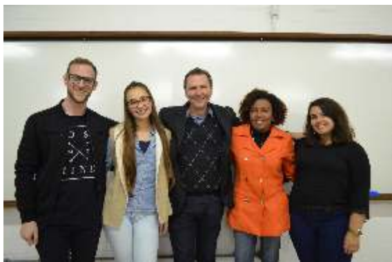
Grupo de pesquisa, o mercado negro: a fé negra - a religiosidade muçulmana dos senegaleses e o mercado de trabalho brasileiro na Região Litorânea Nordeste do RS.

relevante à luta do imigrante em terras majoritariamente cristã. A abrangência territorial poderia ser a mesma, tendo o verão 2016/2017 como o período das entrevistas, já que a presença dos imigrantes no litoral é maior, pela demanda de mão de obra informal.