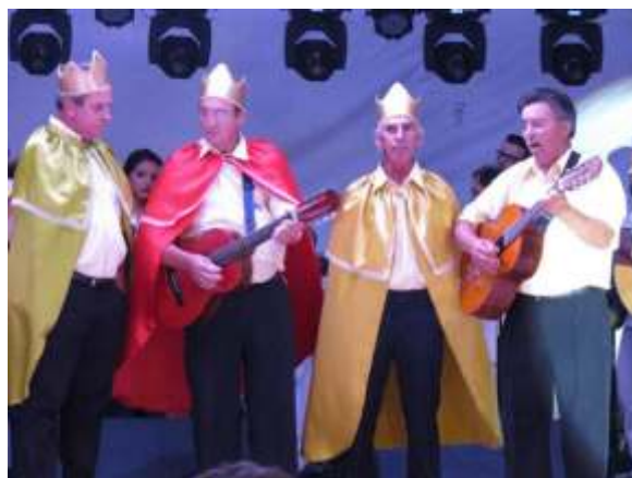
Grupo de Terno em apresentação no evento Noite de Reis/Osório-RS, em 06/01/2016

preserva um ritual que, no imaginário dos envolvidos, se tornou um compromisso de fé, uma tradição de família. Nas vivências das cantorias e na curiosidade dos cantadores, o tempo limite desta história é nascimento do Cristo, no contexto apropriado pelas comunidades cristãs. Fatos históricos e políticos da época não são incluídos, como um questionamento de quem foram os Reis Magos, por que se interessaram em presentear, etc. Tornou-se instigante, pois, como grupo de pesquisa, conhecer e analisar o que se conserva e o que foi alterado nessa tradição – as regularidades e as dispersões discursivas, referindo um aporte teórico (FOUCAULT, 2008 e outros).